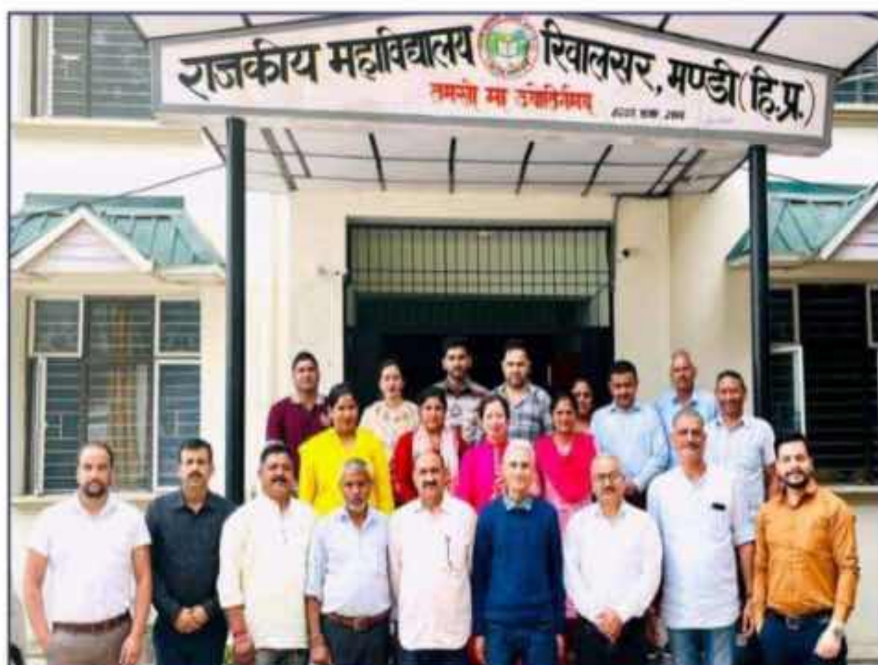
Principal Along with Staff and PTA