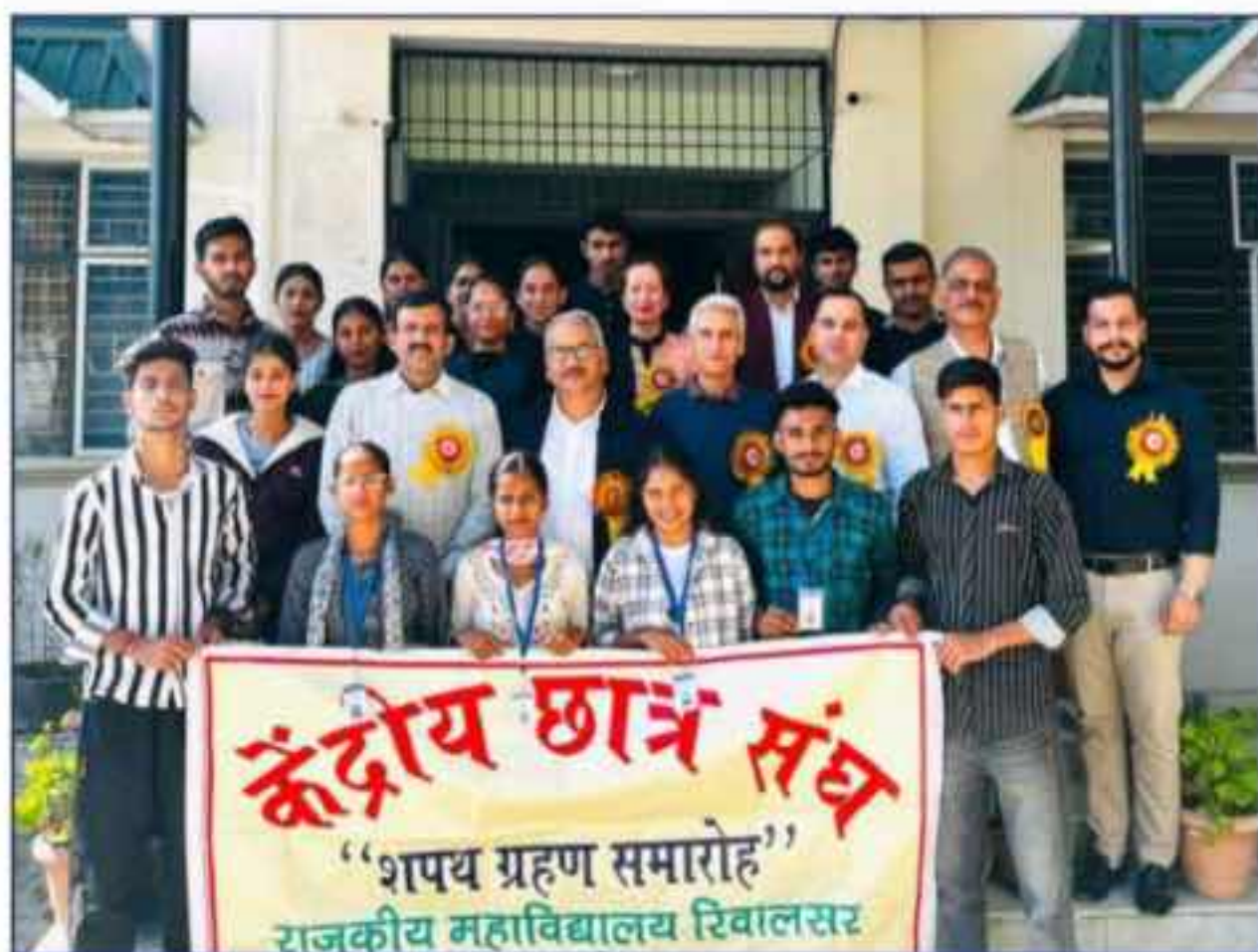
Principal Along with Staff And CSCA