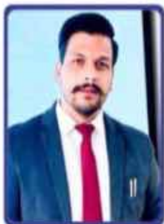
Prof. Yash Pal Teacher Editor