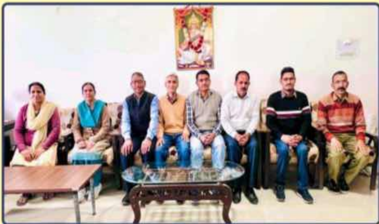
Principal Along with Non-Teaching Staff