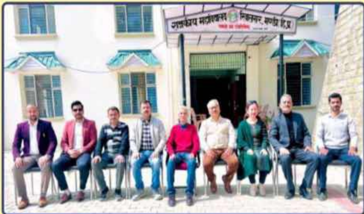
Principal Along with Teaching Staff